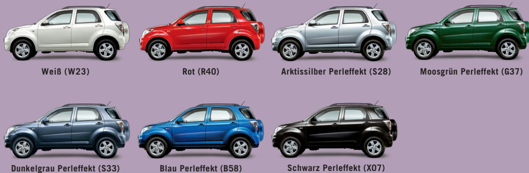
Abb. zeigen Terios Top 4WD.