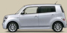
Arktissilber Perleffekt (S28)