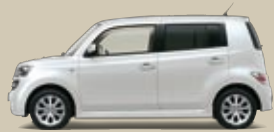
Weiß Perleffekt (W16)