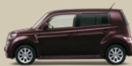
Burgunderrot Perleffekt (R54)