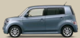
Stahlgrau Perleffekt (S30)