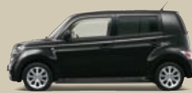
Schwarz Perleffekt (X07)