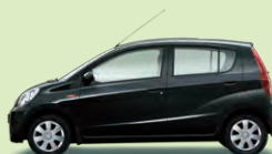
Schwarz Perleffekt (X07)