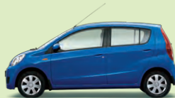
Blau Perleffekt (B58)