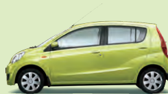
Smaragdgrün Perleffekt (G41)