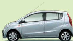
Arktissilber Perleffekt (S28)